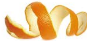
Corteza de limón y naranja

Toda casa payesa disponía de este botiquín vegetal. Utilizamos la variedad Barbados Miller, la que concentra más propiedades.