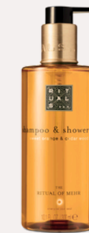
SHAMPOO & SHOWER GEL 300 ml