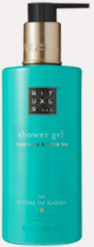
SHOWER GEL 300 ml