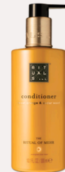
CONDITIONER 300 ml