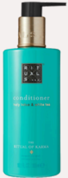
CONDITIONER 300 ml