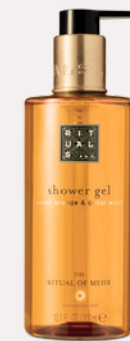
SHOWER GEL 300 ml