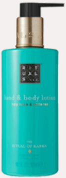
HAND & BODY LOTION 300 ml