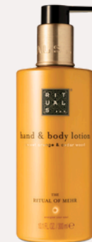
HAND & BODY LOTION 300 ml