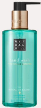
HAND WASH 300 ml