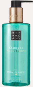
SHAMPOO 300 ml