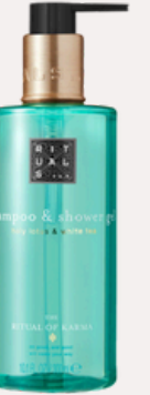
SHAMPOO & SHOWER GEL 300 ml