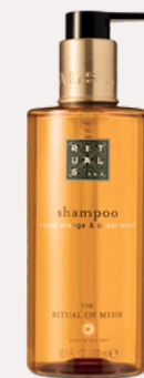
SHAMPOO 300 ml